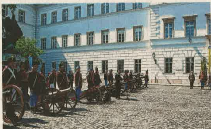
Agúórség a budai várban a hagyományörző napon

Az akcióban meghívott vendégek, a szombathelyi, szegedi, budakeszi, dunaalmási hagyományörző egyesületek tagjai is jelen lesznek.