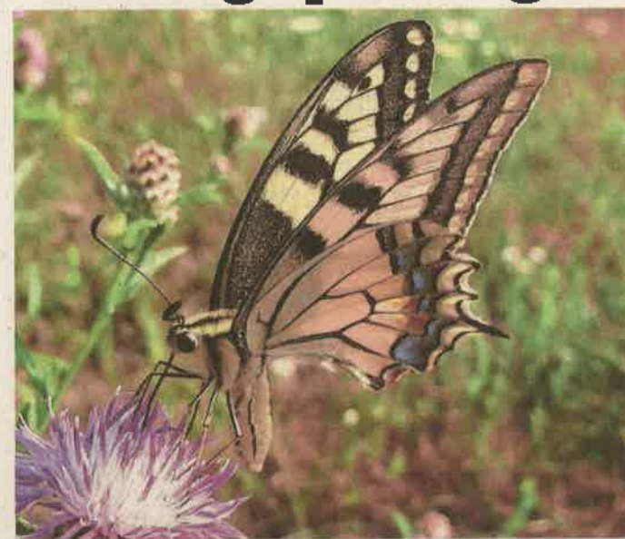
Régi imolán táplálkozó fecskefarkú lepke Bak és Zalatárnok között, a Nénai-völgyben.

A pillangófélék valójában a lepkék rendjének közepes, de főleg nagytermetű színpompás képviselői. Igazi otthonuk elsősorban a trópusok nektárlelő lombkoronaszintje, míg a hazánkban honos négy faj példányai inkább a virágos réteket, napsütötte erdőszéleket és szőlőhegyeket kedvelik.