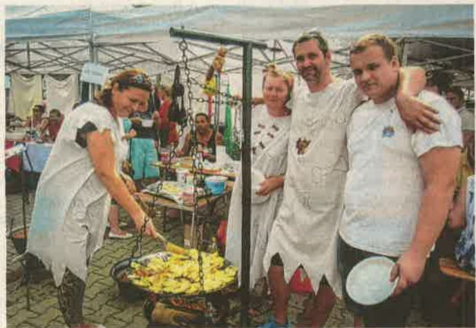
Hangulatos pillanat a tavalyi vadpörköltfőző versenyéről.

ZALAEGRSZEG Vadászati konferenciával és szüreti felvonulással nyit pénteken a megyeszékhelyen az Országos Vadpörkölt és Borfesztivál – Zalai teríték háromnapos forgataga.