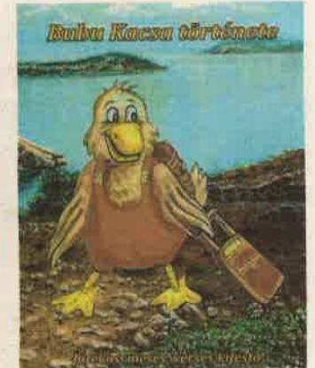
Színezőkkel és feladatokkal

úttal is a családi gyökerek felmutatásával indulnak az összegyűjtött írások, amelyeket fotóillusztrációk támogatnak meg, hogy az olvasó minél plasztikusabb képet kaphasson az eldugott zalai tájban élő nyiladozó értelmű kisgyereket körülvevő környezetről. A kötet érzékeny kaleidoszkópja az író szerterágazó érdeklődési körének. ahzs