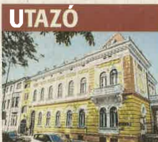
Zenei emlékhelyek Nagykanizsán 12.