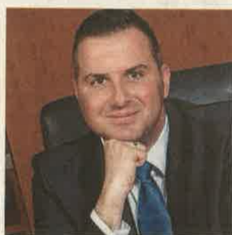
Balaicz Zoltán polgármester

rális fejlesztések, új köztéri alkotásokkal gazdagodott az első írásos említésének 770. évfordulát ünneplő Zalaegerszeg, melynek múltját történelmi konferenciákkal, színvonalas kiadványokkal elevenítették fel. Egymás után újultak meg a város intézményei, bölcsődéi, óvodái, iskolái, orvosi rendelői, sportlétesítményei, útjai. Elindult továbbá három nagy jelentőségű projekt: a 42 milliárdos beruházással már látványosan épülő járműipari tesztpálya, a logisztikai központ és konténerterminál előkészítése, s Zalaegerszeg lett az 5G tesztvárosa. Ami pedig a jövőt illeti: a Településfejlesztési Operatív Program révén 2020-ig 16,8 milliárd forintot fordíthat a város beruházásokra, a Modern Városok Program keretében pedig olyan jelentőségi fejlesztések indulnak el