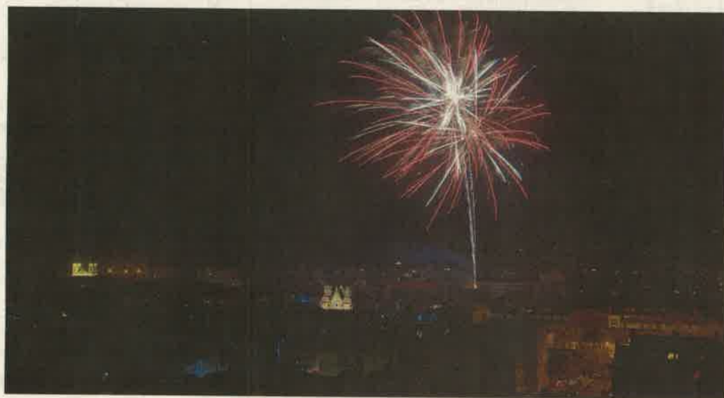
Az idén január 1-jei Dísz téri tűzijáték madártávlatból. 2018 első napján is hasonló látványosság várja az újévet köszöntőket Zalaegerszegen

Idén közel 3 milliárd forint értékben zajlottak infrastruktú-