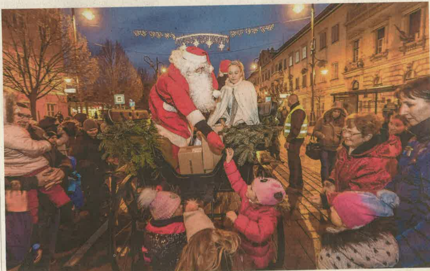
Sok család érkezett tegnap délután a Széchenyi térre, ahol a gyerekek találkozhattak a Mikulással