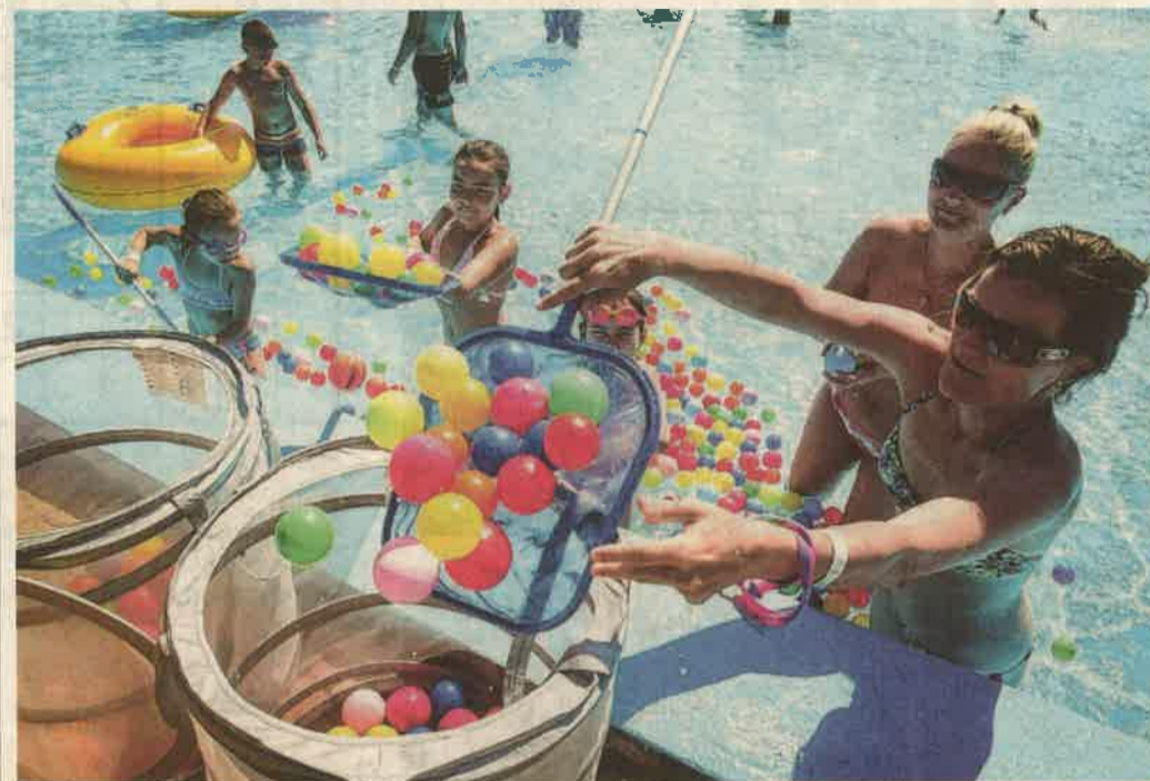
Vidám vízi játékok, mozgásra ösztönző feladatok várták a strandoló családokat.

A Zalai Hírlap játékos sportnapja az AquaCityben