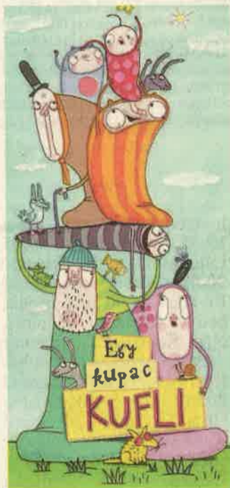
A kuflik a vászonra költöznek

Az Egy kupac kufli című filmből kiderül, hogyan töltik a kuflik a Bújócskázás Világnapját, minek öltöznek, ha nyáron szilveszteri jelmezbálba hívják őket, mit tesznek,