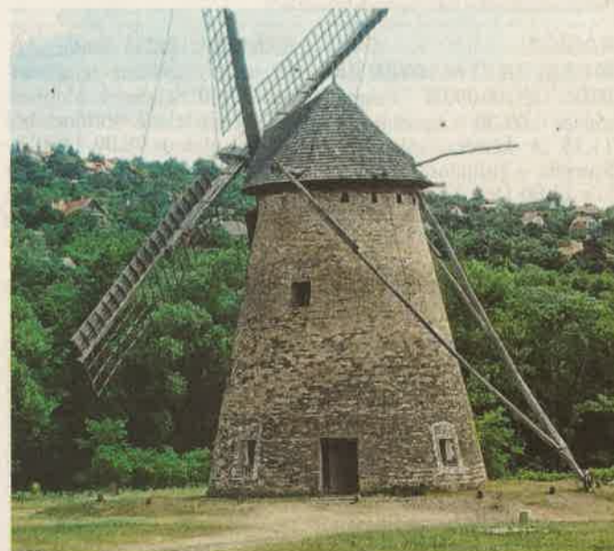
Felújított szélmalom a szentendrei skanzenben

Visegrádon a fellegvár impozáns kőfalai között, a vár történetét, erőrendszerét bemutató kiállítást, a Szent Korona másolatát és itteni őrzésének történetét, korhű panoptikumot, valamint vadászati, halászati, gazdálkodási