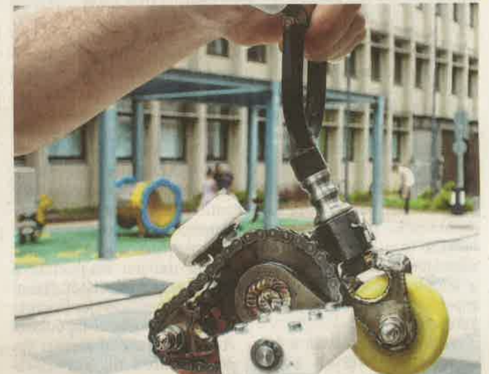
Bármilyen hihetetlen, van, aki tud menni vele

Nemrégiben újabb attrakcióval rukkolt elő: talán a világ legkisebb biciklijét készítette el egy frankfurti bohóc megrendelésére. Hogy milyen paraméterekkel rendelkezik ez az apró, de annál nagyobb teherbírású járgány, arról is szó esik a 13. oldalon.