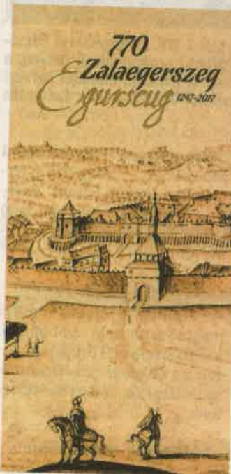
A zalaegerszegi vár első ismert, 1640 körül készült ábrázolása

– Innovatív kísérletként karszalagos rendszert vezetünk be, ami kedvezményekre jogosít, például az éjszakai buszjáratot így lehet majd igénybe venni, amely még a