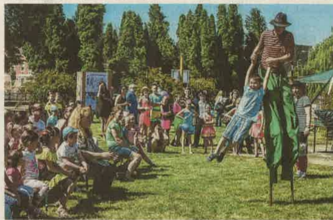
Új színpont: gólyalábask nyitották az egerszegi gyereknapi

– Tavaly határoztuk el a városi gyereknapi teljes megújítását, s ennek nyomán a helyszín is változott – mondja Flaisz Gergő, a szervező Ke-