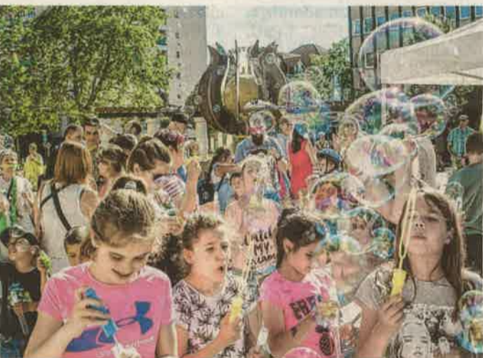
Az akcióval a nevelőszülői hálózatot népszerűsítették.

taluk gondozott gyerekek és a gyermekotthon lakói közösen fújtak szappanbuborékokat, a nevelőszülői hálózat népszerűsítéséért. A későbbiekben számos fellépő váltotta egymást a színpadon, majd este világító lufik emelkedtek a magasba, mutatva a hazavezető utat a csellengő gyerekek számára. mh