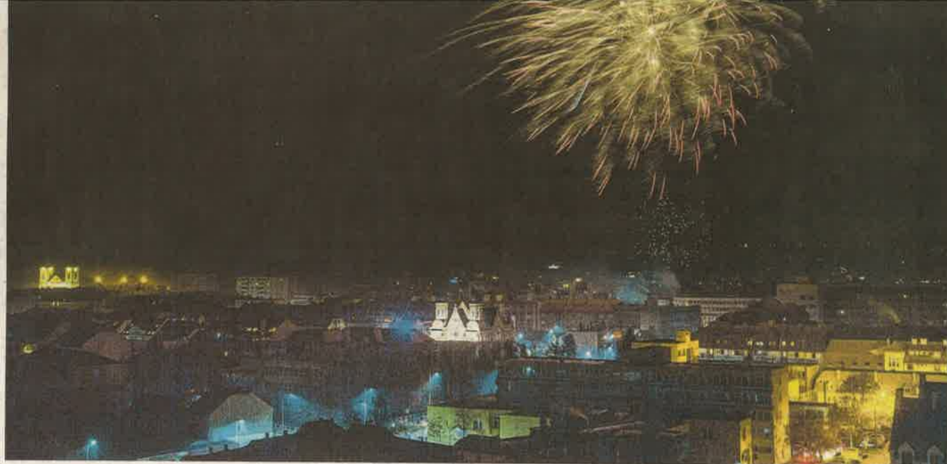
„Telt házat” vonzott a megyeszékhely központjába a hagyományos újévi köszöntő, amit negyedórás látványos tűzijáték követett

Koncertekre, polgármesteri köszöntőre, éjfélkor kezdődő lézershowra, videó- és retródiszkóra invitálta a város és