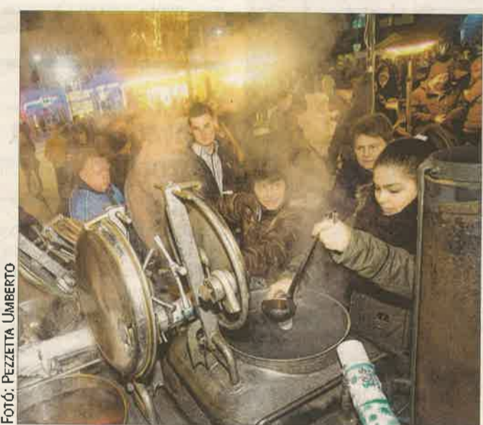
Forralt bor is várta az egerszegi Dísz térre kilátogatókat