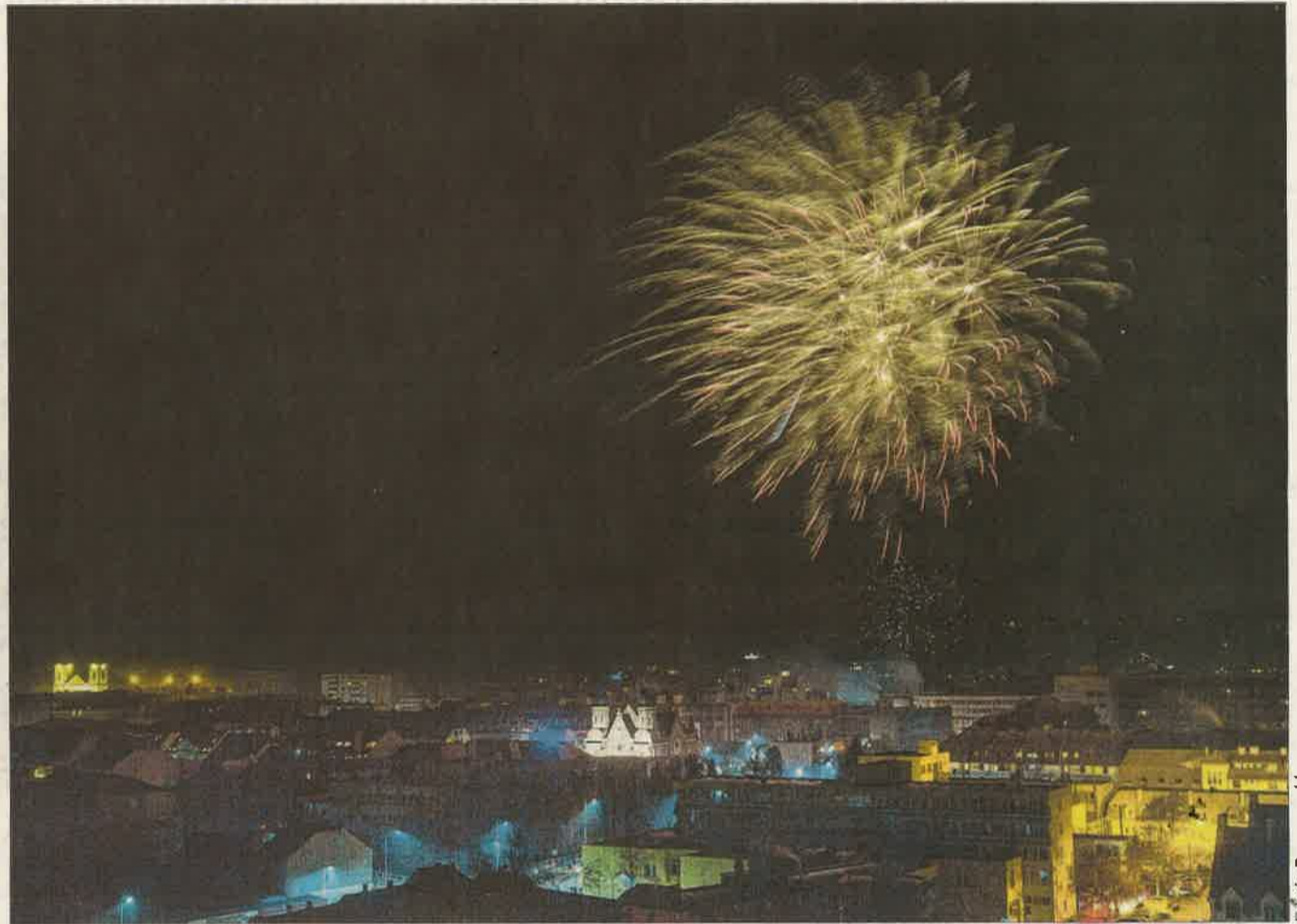
„Telt házat” vonzott a megyeszékhely központjába a hagyományos újévi köszöntő, amit negyedórás látványos tűzijáték követett.

Koncertekre, polgármesteri köszöntőre, éjfélkor kezdődő lézershowra, videó- és retródiszkóra invitálta a város és