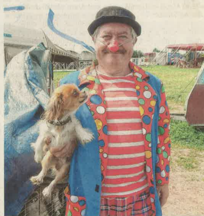
Nem is tudna élni a cirkusz nélkül

közössége. Akkor több település megerősítette korábbi együttműködési megállapodását, és újak is kötöttek. Idén július végén Gyenesdiás 70 fős delegációja a Hargita megyei községben járt, ott ünnepelték meg az egy évtizede létrejött kapcsolatot. A csíkszenttamási küldöttség pedig most hét végén tett vizontlátogatást. Folytatás a 6. oldalon.