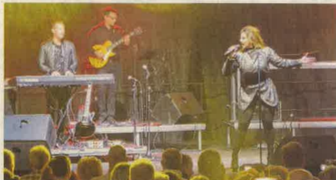
Jenny Berggren az Ace of Base slágereit hozta el

HÉVÍZ A hetedik Hévízi Borünnep legnagyobb érdeklődéssel várt szuperprodukción Jenny Berggren augusztus 20-i fellépése volt. Az Ace of Base-alapító a svéd zenekar legnagyobb slágereit adta elő több ezer rajongó előtt, magyar muzikusok kíséretében.