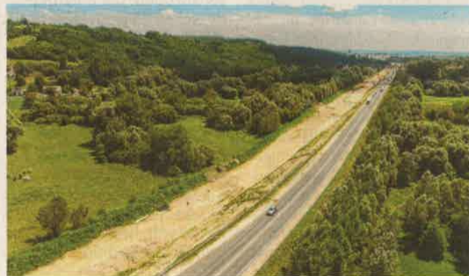
Madártávlatból az építési terület

MURARÁTKA Az M70-es autótűt több mint tíz kilométeres, jelenleg kétszer egysávos szakaszát kétszer kétsávos autópályává építik át. A tavaly kezdődött munkálatok során megépítik a magyar-szlovén határon, Tornyiszentmiklósnál tervezett pihenőhely megnyitáshoz szükséges közműveket, illetve létesítményeket, továbbá a bal pályán meglévő kilenc hidat összekötik a jobb pályán kialakítandó hídszerkezetekkel.