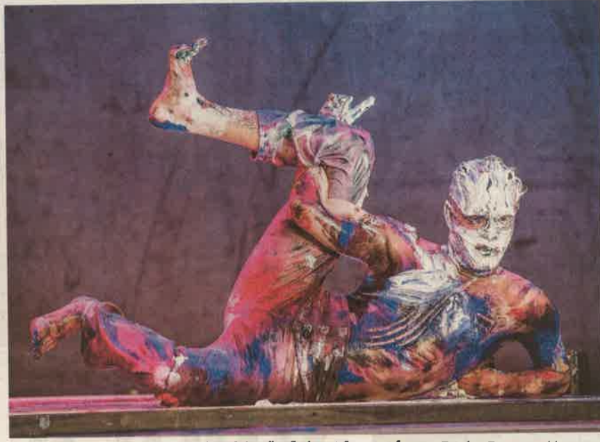
A produkció a tánc, a próza és a képzőművészet furcsa elegye

Az árverés legtöbbször átverésnek hangzott a becsüs ajkán