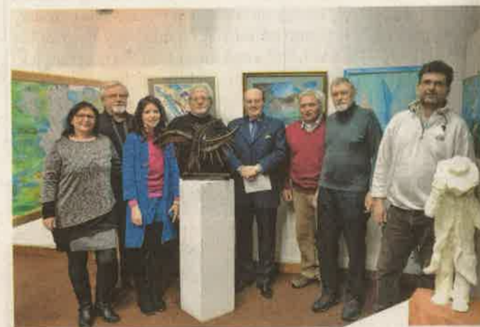
A MÚSZAK kemény magja a tavalyi kollekciót bemutató tárlaton