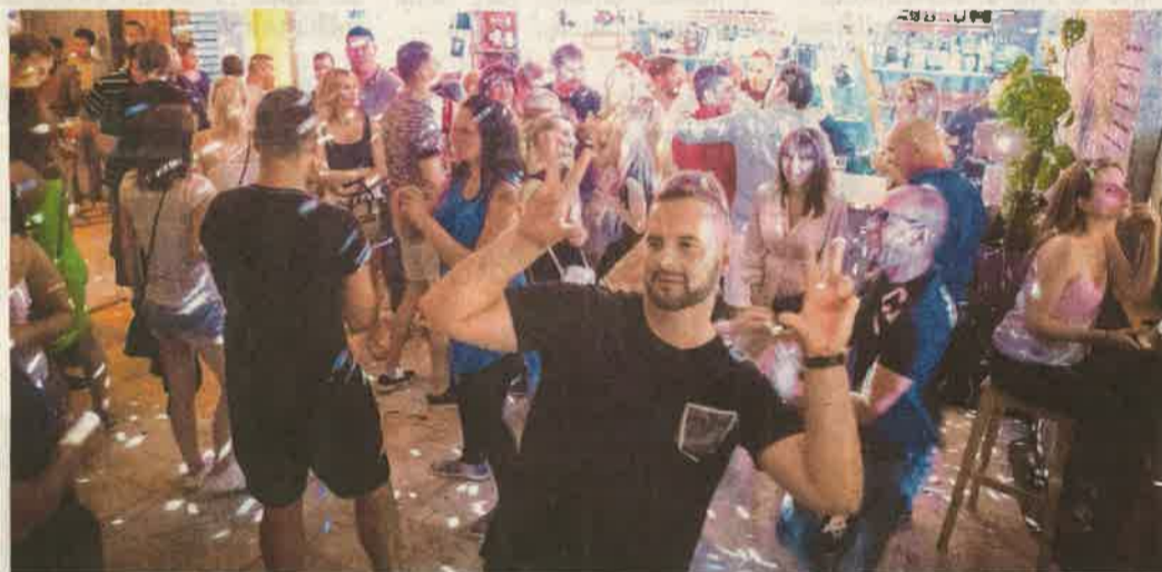
A pénteki zuhó idejére – a rendőrség figyelmeztetése nyomán – mindenki talált fedezéket

dig akadnak újak. Idén például a Down-szindrómás gyerekeket képviselő Kromoprószak. A zsűri számos elismerést kiosztott, a legfinomabb prósza díja a Csepredők Hőseihez került, a legszebben terített asztallal a Szülők a koraszülöttekért csapat rukkolt ki, a dalban előadott recept (idén ez volt a feladat) pedig az Ady-DÖK ajkán csengett legszebben.