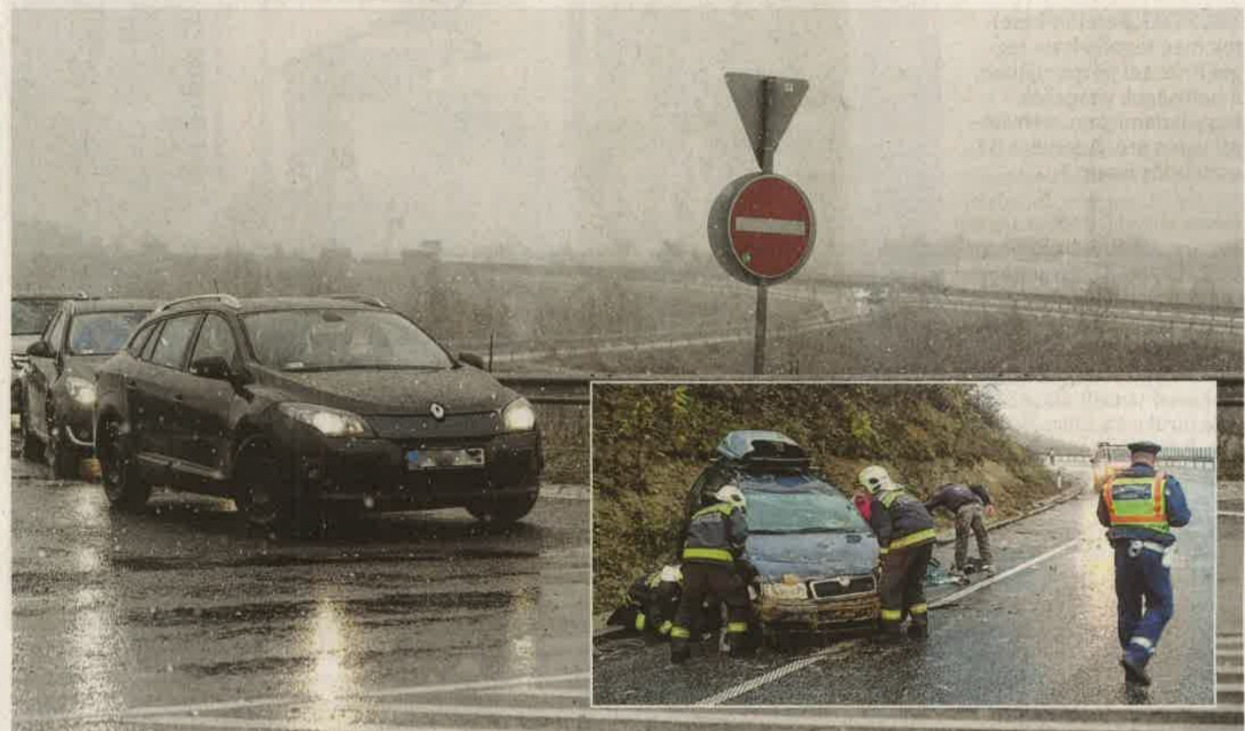
A nagy kép az M7-es autópályán készült, ahonnan rendőrök terelték le tegnap a forgalmat. Jobbra egy baleset: a 76-os úton, a Kapornakietőn csúszott meg és borult fel tegnap egy autó, személyi sérülés szerencsére nem történt.