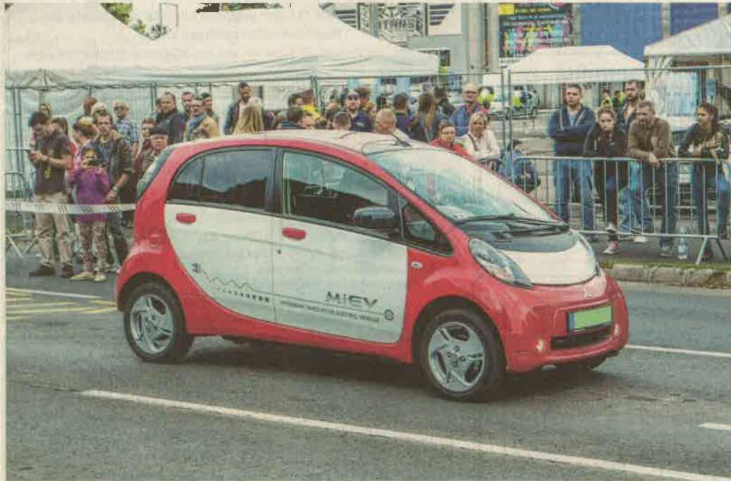
Pillanatkép a tavalyi zalaegerszegi MobElitás rendezvényről

A Besenyői Baráti Kör szombaton táncházat rendez a