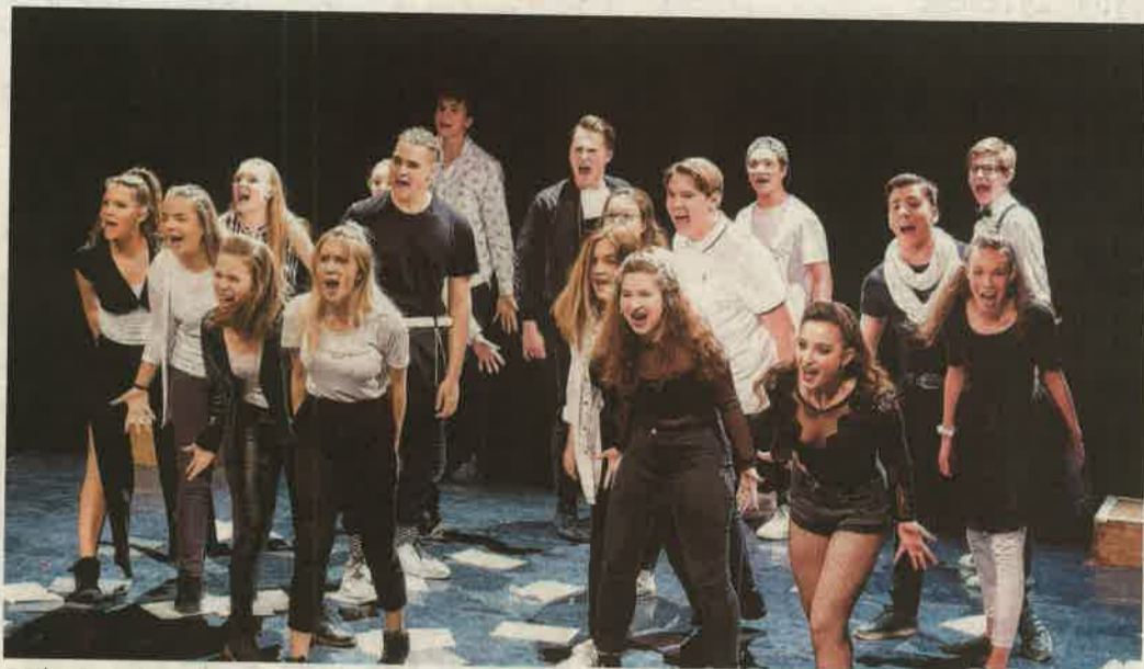
A Vigyázat, érzelmek! című darabban rengeteg fiatalal dolgozik együtt

– Ilyen volt az Angelina Jolie rendezésében A vér és méz földjén című amerikai háborús filmdráma, melyet a fővárosban is forgattak – folytatta. – A film a délszláv háború idején játszódik, amely kettészakította a Balkán-régiót az 1990-es években. A történet Danijelről és Ajláról, két bosnyák fiatalról szól, akik a brutális etnikai konfliktus két szemben álló oldaláról származnak. A fiú boszniai szerb rendőr, a lány a boszniai muszlim művész. Már együtt voltak a háború