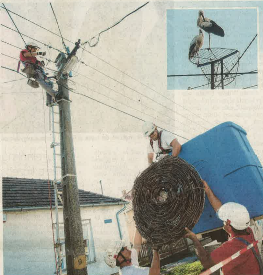
Jobbra fent két, a törött fészektartón „szomorkodó” madár. A nagy képen az áramszolgáltató munkatársai az új fészkekalap felhelyezésén fáradoznak

Folytatás Nagyon várják... címmel a 3. oldalon.