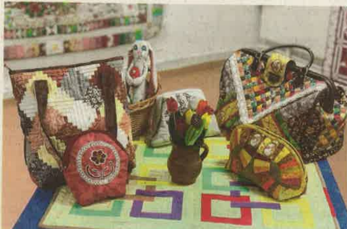
A táskákat is maga készíti, keze hozzájárul a megvalósuláshoz

Ágytakarók, faliképek, falvédők, de játékok és táskák szintén kikerülnek a keze közül, utóbbiakat is teljesen maga készíti.