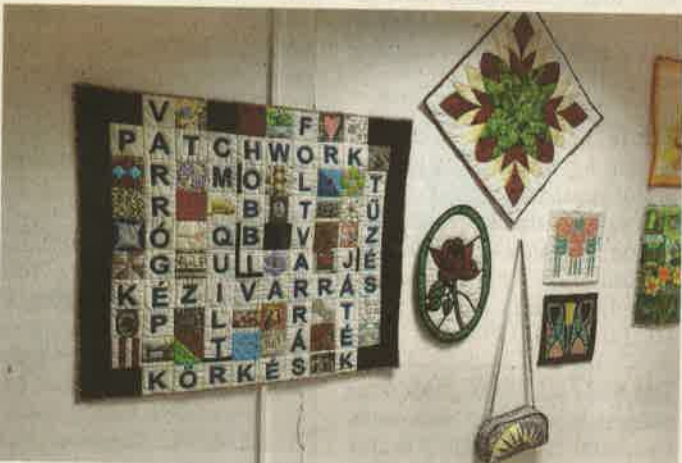
A foltvarrás klasszikus, tradicionális vonulata áll hozzá közel