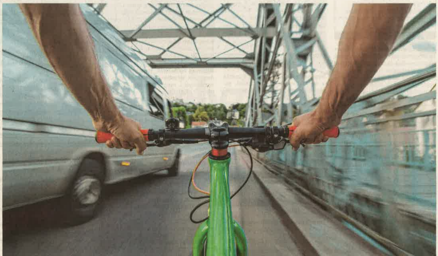
Elég ijesztő a nyeregből nézve, amikor a kerékpár mellett nagy tempóval elrobbog egy természetes gépkocsi

A kampánynak az ad aktualitást, hogy mind több a kerékpáros a városokban és az országutakon egyaránt, ám a kerékpárút-hálózat még nem tud lépést tartani növekvő igényekkel. Emiatt a kerékpárosok és az autósok sok helyütt osztoznak az utakon, ami konfliktusokhoz vezethet. A kerékpárok a városi dugóktól eltekintve lassabbak, a manőverezésük tovább tart, hiszen az emberi erővel hajtva nem képes gyorsulni a gépjárművekhez hasonló módon. Emellett a kerékpár érzékenyebb az út egyenetlenségeire, hibáira, emiatt a kerékpárosoktól gyakrabban számíthatunk váratlan kikerülésekre. Ezért, bár a bringa egy nyomvonalon halad, de közben több helyre van szüksége a szélességénél. Ezért nehéz helyzetbe kerülhet