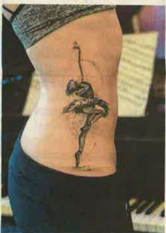
Az oldalunkon különösen fájdaalmas lehet

– Mi volt az első? – Disznóbőrre készült, elég rossz élmény volt. Kicsit el is ment a kedvem az egésztől, hiszen a tű folyamatosan akadózott. A disznóbőr nem olyan