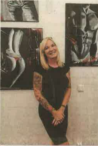
Weide Anca

– Aktuális trendek? – Nemrég a rózsza, az óra és az iránytű ment nagyon. Jelenleg az állatportrék népszerűek, azon belül a nagyimacskák, a tigris, a leopárd, vagy az oroszlán. Farkast is sokan kérnek, amit egyébként szeretek, de már kezd sok lenni. Egy ideig népszerű volt a végtelen jel a csuklón is, de szerencsére már kezd kikopni a divatból. Mostanában inkább nagyobb