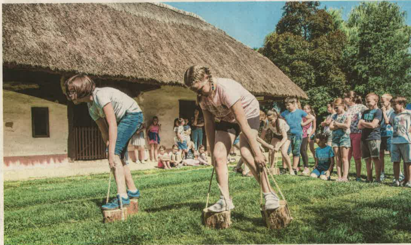
Lépés közben megfeszíteni a kötelet, aki ezt jól csinálta, annak könnyen ment a sáron járás