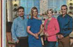
16.15 Család-barát válogatás Család-barát június 17-től augusztus 25-ig nyári ismétlődő válogatás adásokkal jelentkezik az évad legemlékezetesebb pillanataiból.