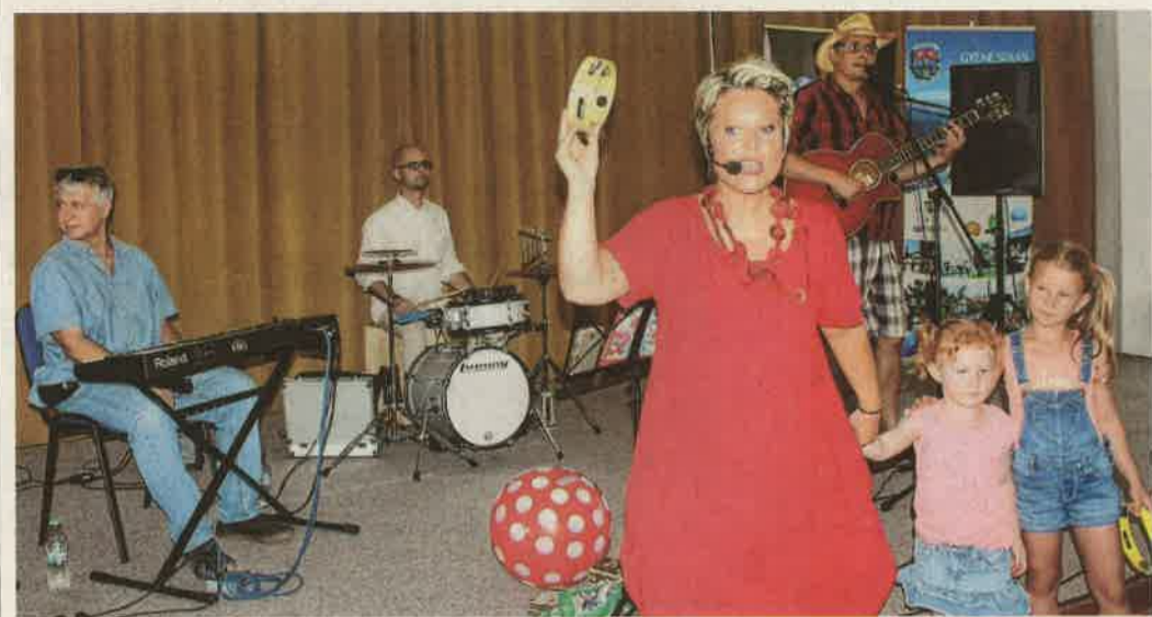
A Cimora együttes remek hangulatot teremtett interaktív koncertjével

A felnőttekből is előcsalogatták a gyermeket