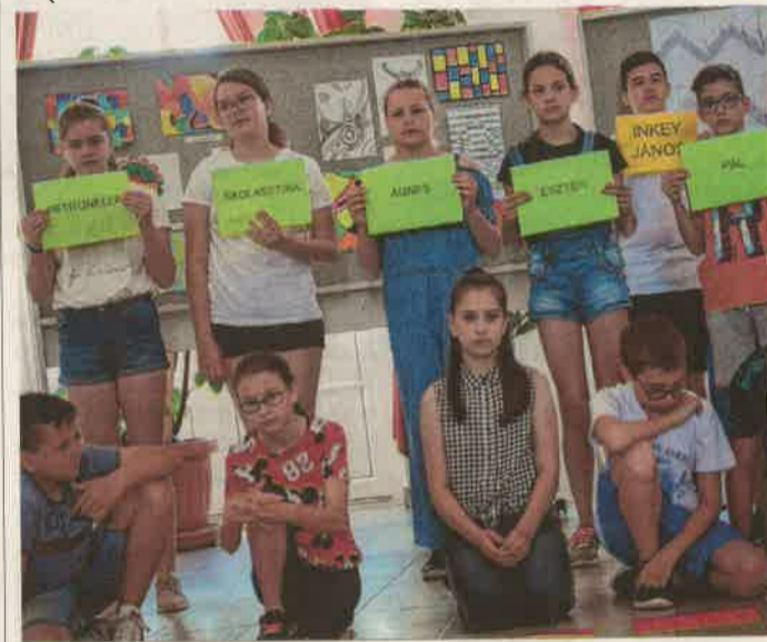
A házigazda intézmény diákjai rendhagyó előadással mutatták be iskolájukat a vendégeknek

Az ökoiskolák a természet szeretetére tanítják meg a diákjaikat