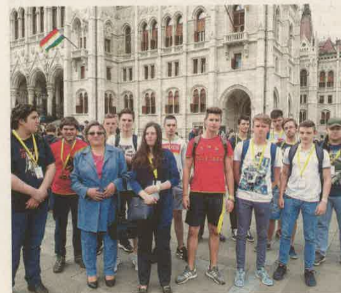
A 11.b osztályos zalaegerszegi diákok számára is felejthetetlen élmény volt a Kossuth téri közös éneklés

Az éneklést követően lehetőségünk nyílt bemenni a Parlamentbe, és az épület megcsodálása közben megtekinthettük a Szent Koronát is. Egy zalaegerszegi származású, Budapesten tanuló végzős egyetemista segített bennün-