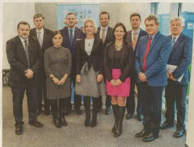
A PVSZ soros ülésének résztvevői.

ZALAEGRSZEG „Mivel az önkormányzati választások bizonyos településeknél változásokat hoztak, fontosnak tartottuk, hogy valamennyi tagváros újra találkozzon és meghatározza a jövőben elérendő célokat.”