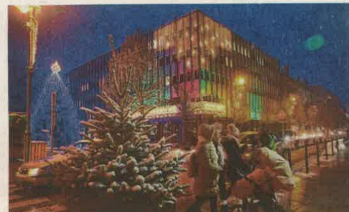
Fényfestés a polgármesteri hivatal épületén

December 16. (hétfő) 15.30 Napsugár utcai Tagóvoda műsora