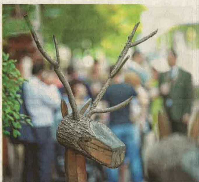
Ma kezdődik a vadpörköltfesztivál Egerszegen

A letenyei Béczi-hegyen vasárnap 13 órától hegyi búcsút tartanak. A szentmise után a meghívott vendégek, köztük a Bazseva és a Magyar Állami Népi Együttes műsora színesíti a napot.