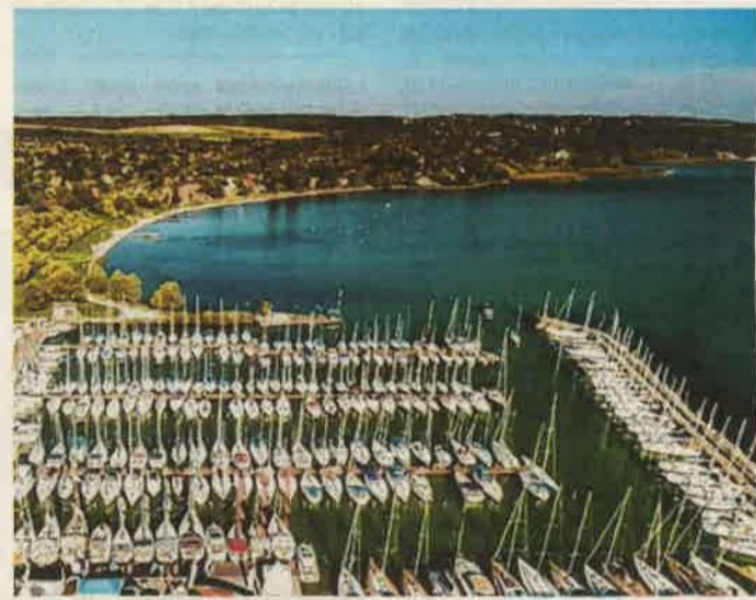
Vízparti hajókiállítás Balatonkenesén

Szeptember 6-8., Badacsony A régió egyik legimpozánsabb őszi rendezvénye, az