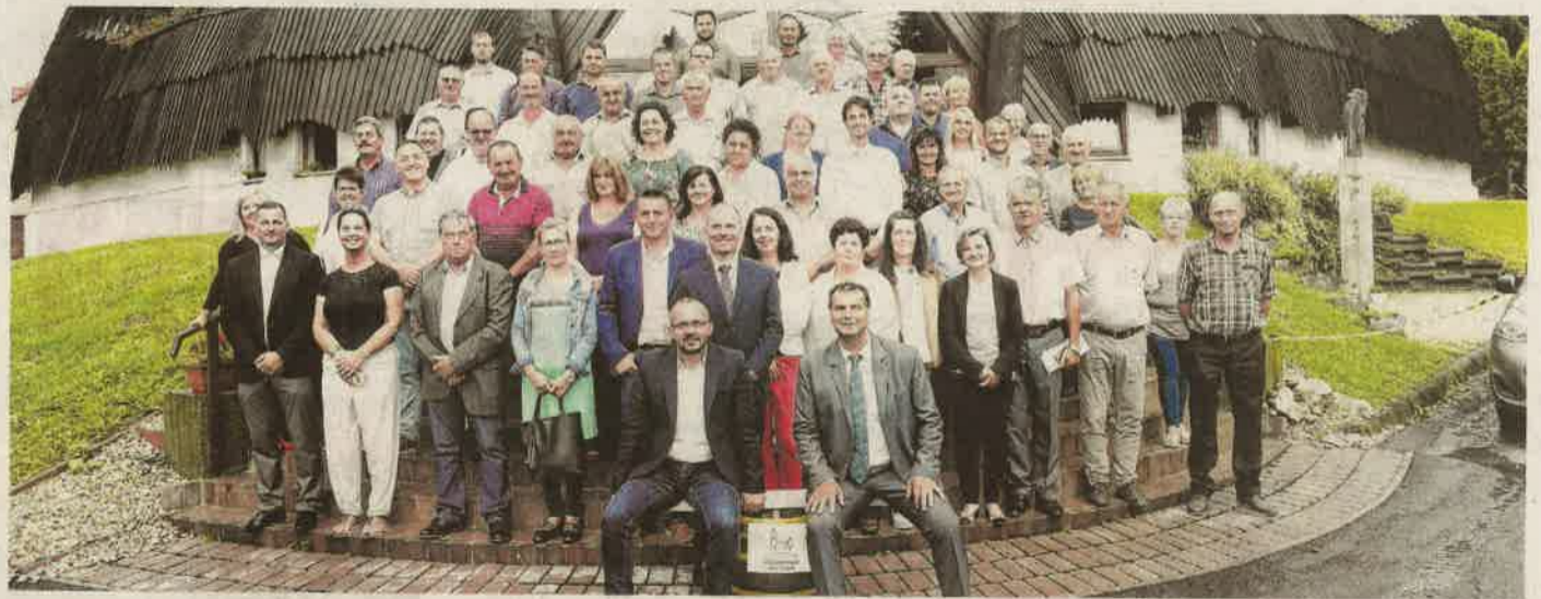
A fórum résztvevői a baki faluháznál, az első sorban Gyopáros Alpár kormánybiztos és Vigh László országgyűlési képviselő

Vigh László országgyűlési képviselő, miniszteri biztos szervezésében egyebek közt a Magyar Falu Program aktualitá- sairól juthattak információk- hoz a polgármesterek, akiknek Gyopáros Alpár, a modern tele- pülések fejlesztéséért felelős kormánybiztos tartott ismerte- tőt. A fórum előtt pedig sajtótá- jékoztatót tartott a két politikus a kistérségüket segítő prog- ramról. Folytatás: 4. oldal.