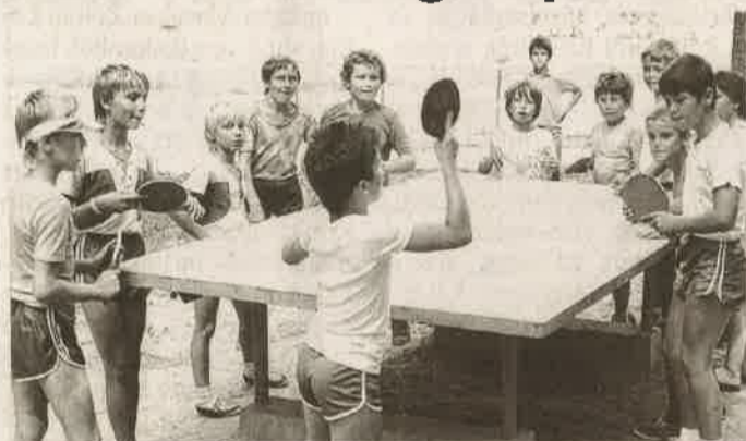
Pingpongozó gyerekek 1989 augusztusában

ZALAEGRSZEG Lapunk archívumából régi nyarakat idéző képösszeállítással jelentkeztünk a 12. oldalon, Múltidéző rovatunkban. A megyeszékhelyi napközis tábor nyolc-