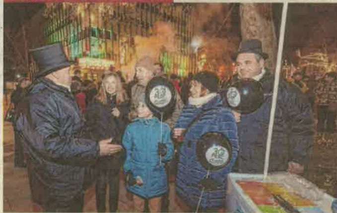
Kedves szívfoltja volt a tegnap esti újévköszöntő belvárosi programnak a kéményseprők részvétele. A szakemberek közül ketten is ott voltak a Dísz téri rendezvényen, s fekete cilinderben, munkaruhában egy-egy léggömb átadásával személyesen is boldog új évet kívántak a járőrelőknek. HP