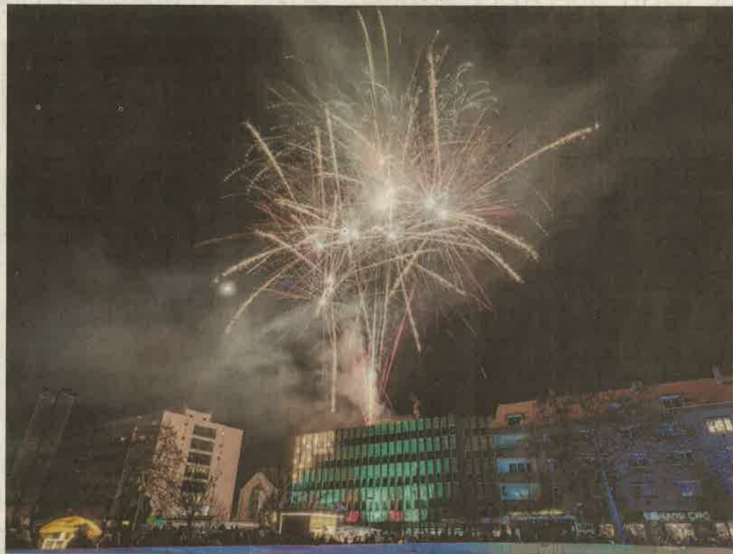
A színes rakéták látványa hosszan az égboltra szögezte a tekinteteket

Az újévet köszöntötték tegnap este a belvárosban