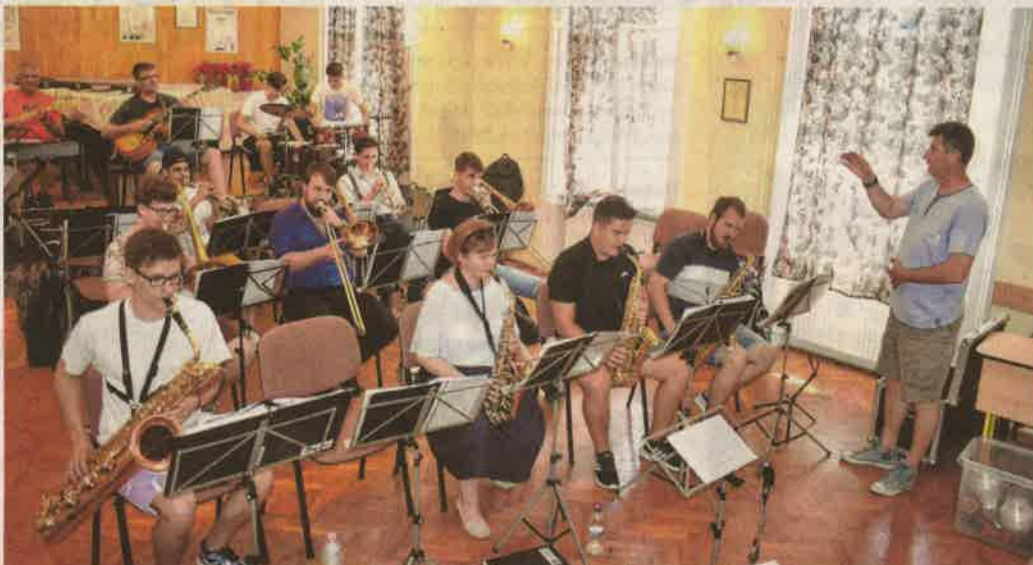
Próba a zeneiskola nagytermében. A Kanizsa Big Band tagjaira új kihívás vár