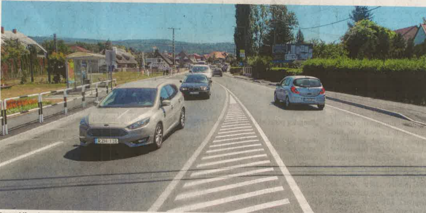
Az 1,2 kilométeres szakaszt, illetve a környezetét majd 440 millió forintból korszerűsítették.

Átadták a 71-es főút megerősített gyenesei szakaszát