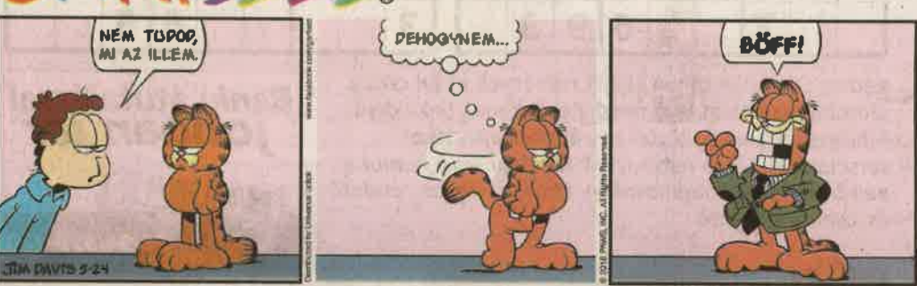
További képsorok olvashatók a Garfield magazinban és a Zseb-Garfield könyvsorozatban. www.garfieldmagazin.hu