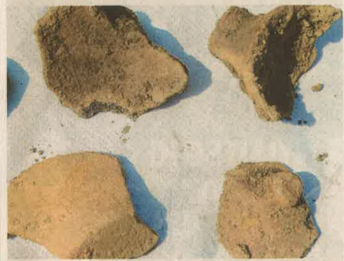
Cserépedények, fazekak maradványait találták