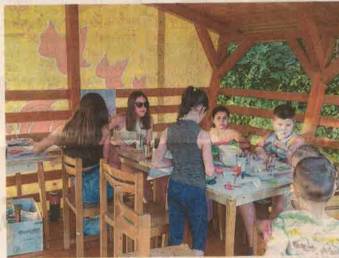
Rajzolni, festeni, ragasztani is lehetett