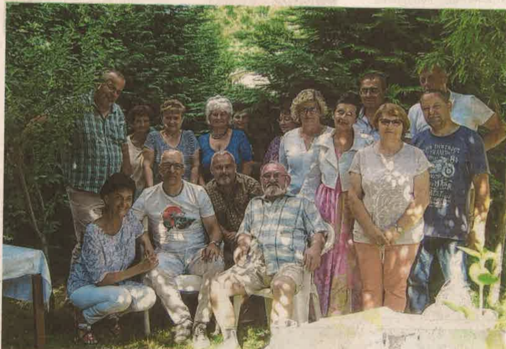
Az 1981-ben érettségiző osztály tagjai ismét találkoztak

– Tanítványaim az iskolai évek alatt is összetartó kis csapatot alkottak – mondta az osztályfőnök. – Életpályáik, előmeneteleik mutatják, hogy a családjukért, kisebb-nagyobb közösségeikért, vállalkozásaikért sokat dolgoznak. Munkáikkal, egyéni teljesítményeikkel is szűkebb-tágabb