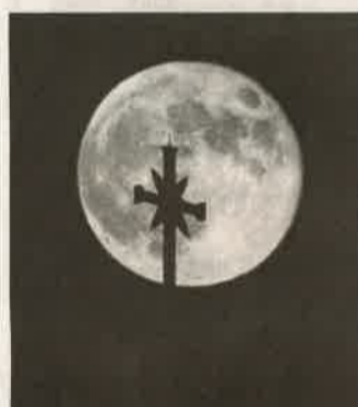
Most fényesebb volt

ZALAEGRSZEG Május 26-án az időjárás kegyes volt, így káprázatos fotók készülhettek az idei év ötödik holdtöltéjéről, ami ráadásul egybeesett a Hold földközelségével, azaz a perigeummal. Amikor az égitest a legmesszebb kerül a Földtől, akkor 405 ezer ki-