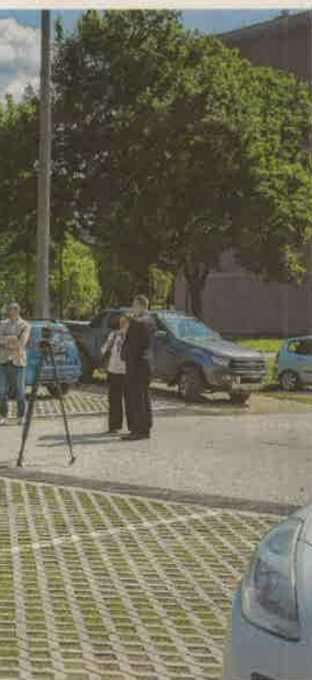
Gyülekeznek az újságírók a helyszínen