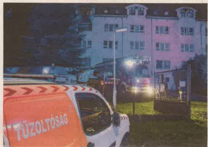
Öt városból mintegy ötven tűzoltó vonult a helyszínre