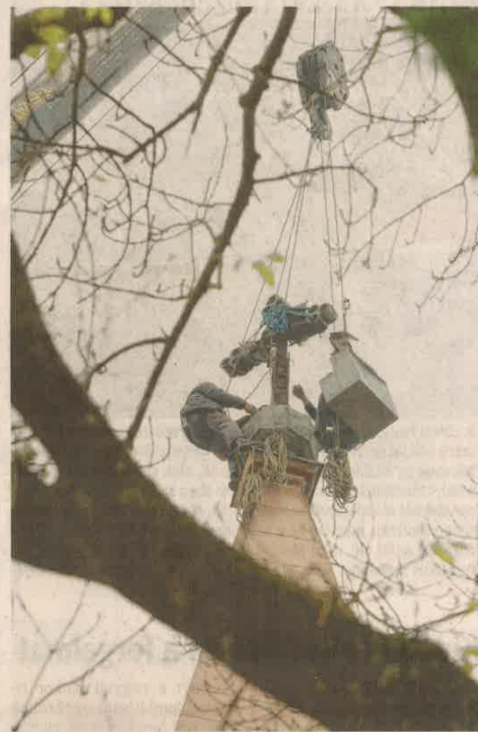
A szakemberek már az első szemrevételezésnél látták, hogy a kereszt manóviro rozcsá állapottban van