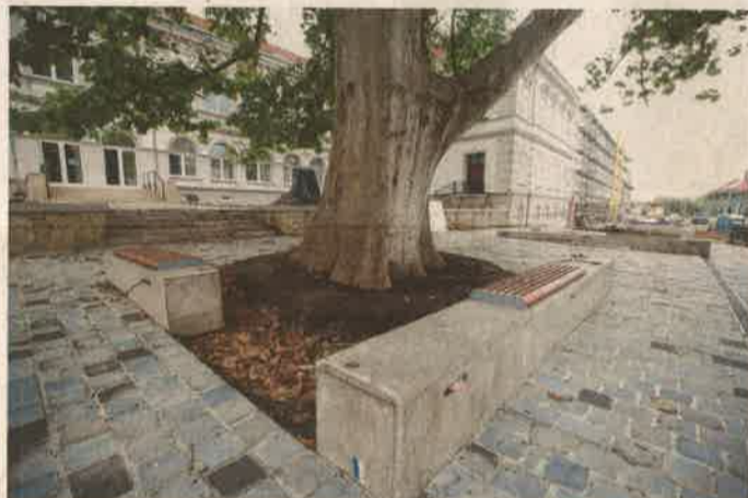
A múzeum előtti, körbebetonozott platánfa

ZALAEGERSZEG A járvány miatti másfél éves kényszerűsünet után közgyűlést tartott a héten a Zalaegerszegi Városvédő Egyesület.