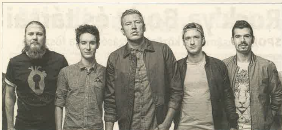
Halott Pénz: június 11-én, szombaton 22.30-as kezdéssel a nagyszínpadon