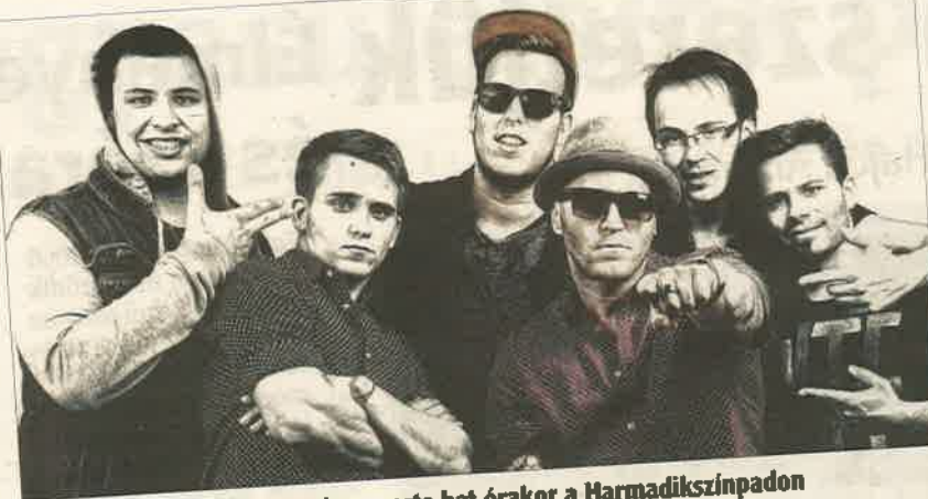
A The Griffins együttes vasárnap este hat órakor a Harmadikszínpadon

A nemzetközi minősítéssel is rendelkező egy hónapos tavaszi fesztivál célegyenesbe érkezik a következő két hétben