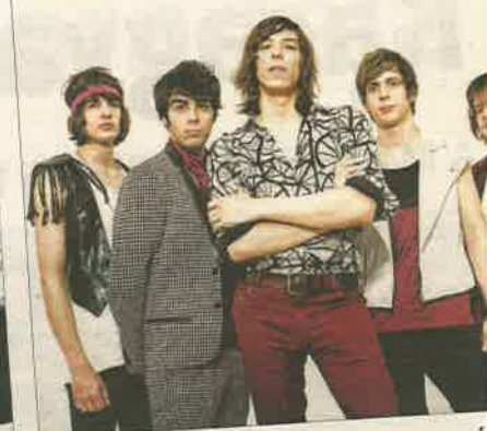
Szombaton este fél kilenckor a nagyszínpadon (Széchenyi tér) zenél az Ivan and the Parazols