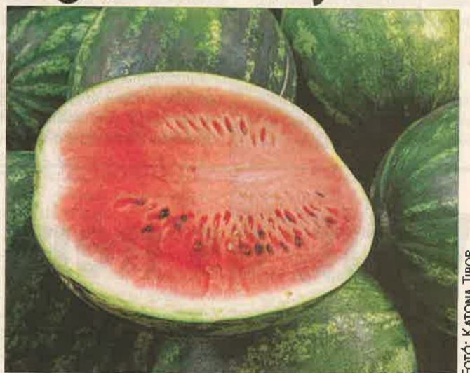
Sok áruházban meg lehetett kóstolni a hazai gyümölcsöt

A hatóság intézkedett a kifogásolt tételek gyártóhoz való visszazállításáról és növényvédelmi bírságot szabott ki az olasz termék hazai forgalmazójával, az Agro Natura Kft.-vel szemben.