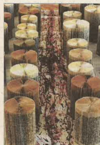
Az út – könyv installáció (2006)

– Meg is szenvedtem Szegeden az ábrázoló geometria szigorlatot – utal fejét csóválva az immár Magyarországon megszerzett rajztanári diplomára. Jövőre lesz 30 éve, hogy Zalaegerszegen telepedett le, a város tavaly Pro Urbe-díjjal