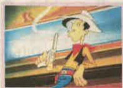
14.00 Lucky Luke... Felépül a szorgalmas telepesek városa, miután sikerül egyezséget kötni az indiánokkal. Am megjelennek a rabló Dalton fivérek...