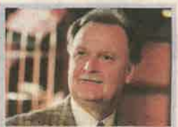
21.45 Az áldozat visszatér Az irodában felbukkan a közjegyző, késsel a hátában, és az asztalra hanyatlik. Am mire kiér a rendőrség, a hulla eltűnik.