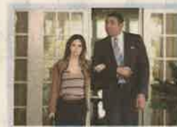
20.35 Szívem... Bluebell két esküvőre is készül, de miért győző több nő is makacs csuklás? Wade remek ajánlatot kapott, és Atlantába akar költözni...

Matt Damon első három Bourne-filmje 2002 és 2007 között csaknem egymilliórd