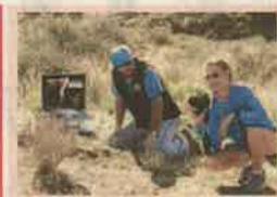
21.20 CSI: A helyszínelők Holtan találják egy anyát, mellette egy sérült kislánnyal. A férjet gyanúsítják, aki azt állítja, hogy vadászatban volt...