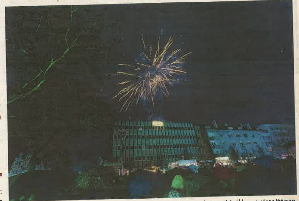
A szemerkélő eső ellenére több százan gyűltek össze január elsején, a kora esti órákban a város főterén, hogy a hagyományok szerint együtt ünnepeljenek az új év első napján

tán polgármester elmondta: jó lenne, ha a 2018-as esztendőben is meglenne az az összetartás, összefogás, korrektség, amely az elmúlt esztendőben is jellemezte a város közösségét. Emellett folytatódjanak tovább a nagy fejlesztések, a meghirdetett projektek