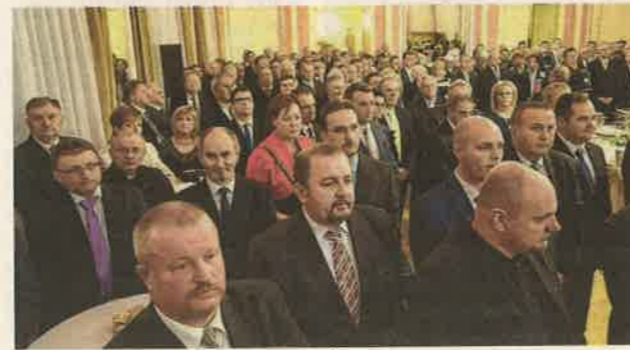
A hagyományos újévi fogadáson több százan emelték poharukat a sikerekre

házásait is tartalmazó másfél milliárdos projekt előkészítése és tervezése lezajlott, így 29 helyszínen kezdődnek 2018-ban útfejlesztések. Emellett a szakemberek tervezik a Zalaegerszeget az M8-as úttal, Vasvárral összekötő kétszer kétsávos gyorsforgalmi utat, a városunkat az M7-es autópályával összekötő R76-os kétszer kétsávos gyorsforgalmi út