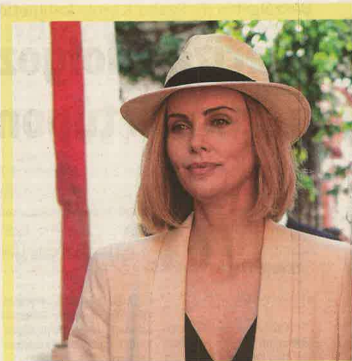
A Csekély esély című magyarul beszélő, amerikai vígjátékot mindkét zala-

HALAK: Az élet több területén válaszut elé kerül. Mérlegeljen alaposan, próbáljon meg több szempontból is megközelíteni egy-egy kérdést! Tanuljon meg nemet mondani! Ne akarjon mindenkinek megfelelni.