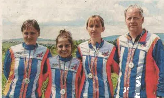
A ZTC senior csapata érmmel térhetett haza az országos középtávú és váltóbajnokságról

A Veszprém megyei Öskü térségében, egykori katonai gyakorlóterület adott otthont a tájfutók idei országos középtávú és váltóbajnokságának, ahol több mint 1000 induló állt rajthoz.