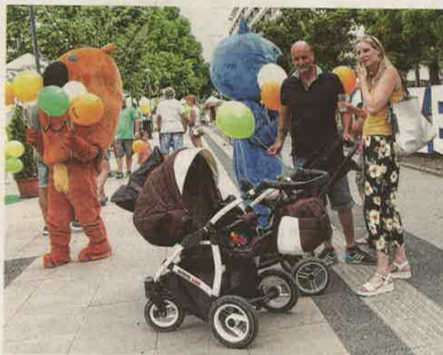
A több helyszínen zajló rendezvénysorozat valamennyi korosztály számára izgalmas, látványos és sokszínű programot kínál.

A Széchenyi téren népszerű együttesek – köztük a Köztársaság Bandája, a Góbé Zenekar, a Kaukázus, a 30Y – lépnek majd fel. Júni-