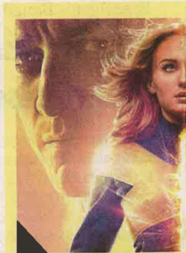
Az X-Men: Sötét Fönix (X-Men: Dark Phoenix) filmjét a zalaegerszegi Cinema City.

17:40 20:00 (csak szerda) 20:20 (kivéve hétfő, szerda) 22:30 (csak péntek-szombat) 12:20 (csak szombat-vasárnap)