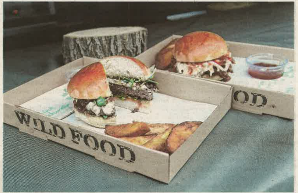
Szarvas- és vaddisznóburger csábította a látogatókat a vadászegyesület standjához