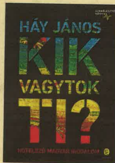
Izgalmas irodalomtörténeti utazás más szemszögből

– Minden, ami betű, az számomra érdekes, s nem csupán könyvek, de az újságok is; és lépést tartva a korral, a telefonomat, számítógépet is gyakran használom erre a célra, de természetesen amit nem tud semmi pótolni, az a kézzelfogható nyomtatott könyvek illata, tapintása, ami egész kisgyerekkorom óta elvárásom. Ötéves koromban már olvastam, ami leginkább annak köszönhető, hogy édesanyám történelmet is tanított akkor és az ötödikes történelem tantervében olyan izgalmas képek voltak, hogy mindenáron meg akartam tudni a mögöttes tartalmat is. Így hát autodidakta módon, a