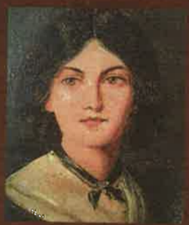
Emily Brontë a Windfell asszonya című romantikus regényében is megörökítette a helyet.

Ponden Hall könyvtára, amelyben Shakespeare művei is megvannak, nagyon fontos volt a Brontë nővérek számára, gyakran használták.