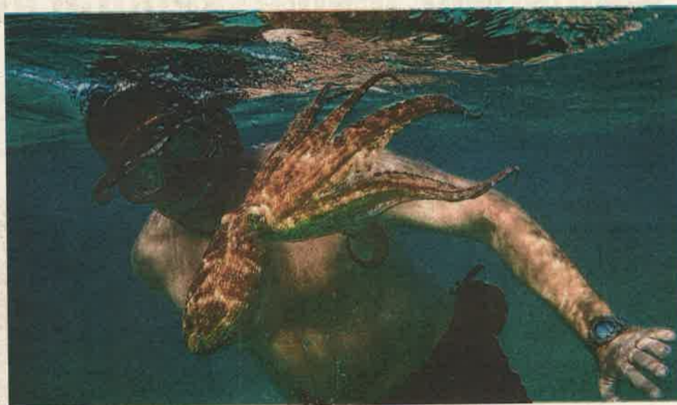
A film Craig Foster merüléseivel indít, ahogy a dél-afrikai partok mentén, egyszerre csodálatos és félelmetes környezetben jut egyre mélyebbre, a legfurább vízi állatok fürkésző tekintetétől kísérve

A film Craig Foster merüléseivel indít, ahogy a dél-afrikai partok mentén, egyszerre csodálatos és félelmetes környezetben jut egyre mélyebbre, a legfurább vízi állatok fürkésző tekintetétől kísérve. Aztán egyszer megpillant egy polipot, és mint egy klisés szerelmes filmben, elindul az a bizonyos zene, megszólal egy belső hang, és Craig szinte megszállottja lesz a nyolc csáppal rendelkező állatnak, egy teljes éven át jár a nyomában. Craig az eseményeket saját maga kommentálja, nem egyszer könnybe lábadt szemekkel nyilatkozik, egyértelműen spirituális utazásnak fogta fel ezt az időszakot, ami alatt