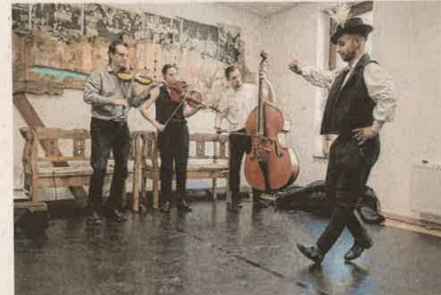
Verbunkverseny és a IV. Göcseji Kézműves Nap a Göcseji Tudásközpontban