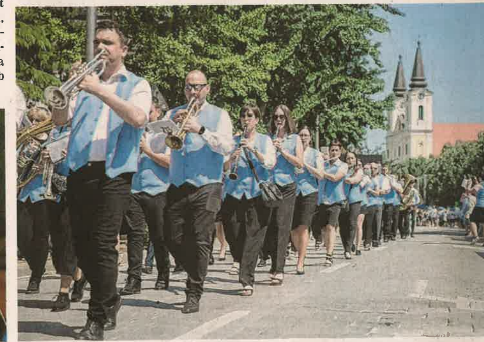
Négy zalai fúvószenekar lépett fel a fesztiválon

Az EgerszegFesztben telt házú koncertet adott Korda György és Balázs Klári. A legendás énekespár slágereit és a látványos előadás szinte minden nézőnél hatalmas ovációt váltott ki.