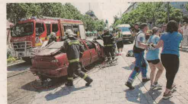
Baleseti szimuláció a Széchenyi téren