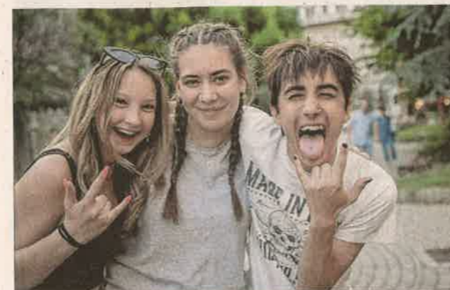
Fiatalos energiák az EgerszegFesztben

Zalaegerszeg idén is megtelt étellel az EgerszegFeszt, amely a június 13-i nyitóbulitól a június 15-i apák napi programokig kínált színes élményeket. A fesztivál fókuszában a helyi értékek, a kulturális hagyományok és a közösségi összetartozás álltak, miközben a könnyűzenei koncertek és a gasztronómiai kínálat is remek kikapcsolódást nyújtottak.