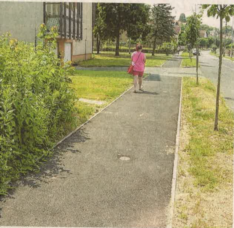
Újult meg a Bartók Béla és az Olajmunkás utcákban