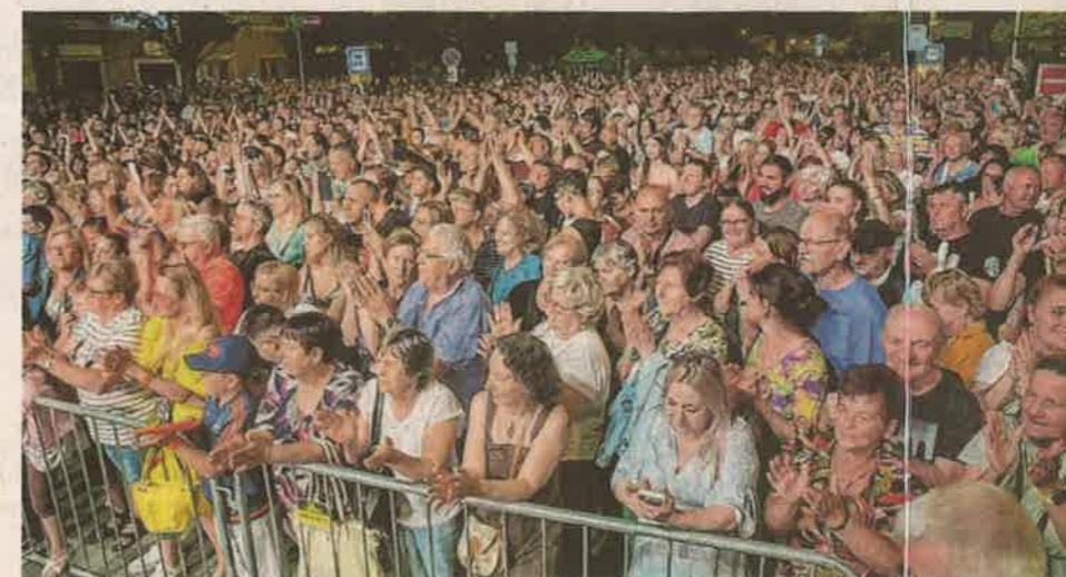
Június 13. és 15. között rendezték meg az EgerszegFesztet

Zalaegerszeg három napon át a kultúra, a zene és a közösség fővárosa lett az idei EgerszegFesztben, június 13-15 között. A belváros utcáit fiatalok, a kézműves portékák között válogató családok, míg a színpadokat zenészek, néptáncosok, fúvószenekarok töltötték meg. A fesztivál színes programkavalkádjával igazi generációkat összekötő ünneppé vált, ahol a régi értékek és a mai lendület találkozottak.